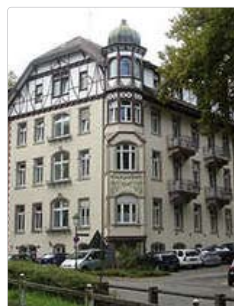
Die Oberrheinischen Kliniken greifen bei der Zuweiseransprache auf die Adressen von ArztData zurück.